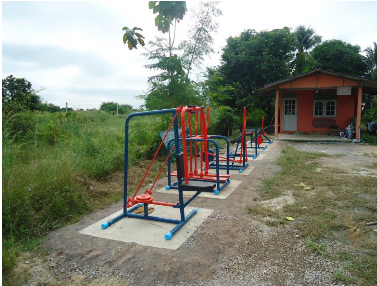
5. ลานกีฬา/สนามกีฬา บ้านนาคอก หมู่ที่ 4